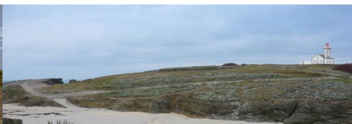
La gestion du piétinement avant – après restauration