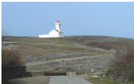
Le stationnement avant-après aménagement