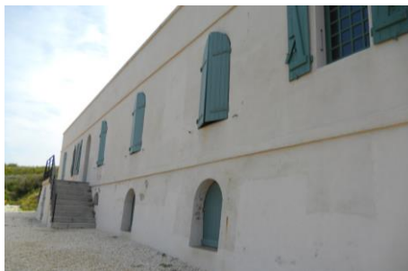
La villa Lysiane avant-après travaux