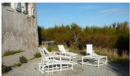
Le Saratorium, au pied du fort