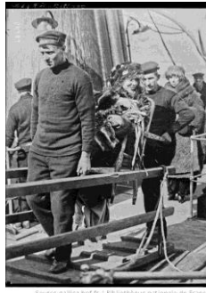
La chaise à porteur qui lui servira pour se déplacer après son amputation