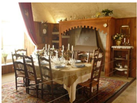
La salle à manger et le salon