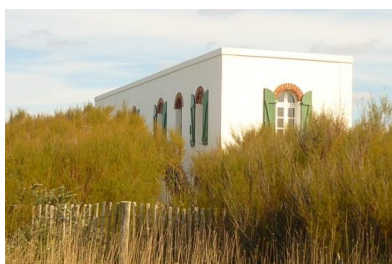
La Villa Lysiane, la villas des amis