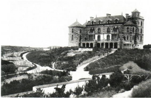
Carte postale du manoir de Penhoët qui sera malheureusement détruit en 1944