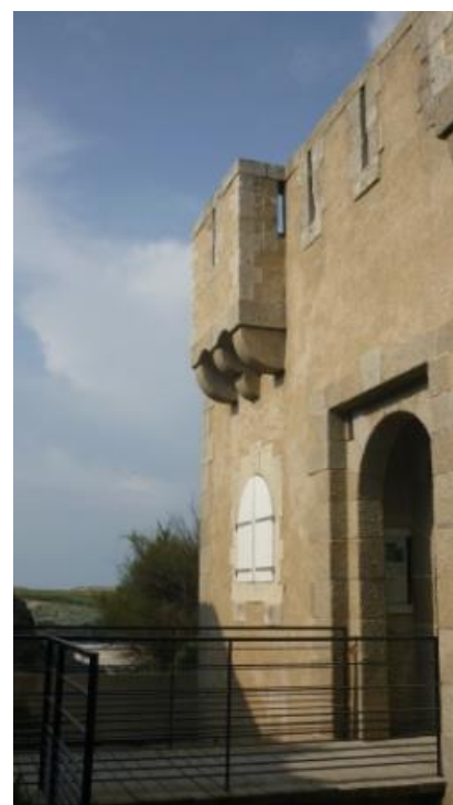
La passerelle d'entrée du fort Napoléon III