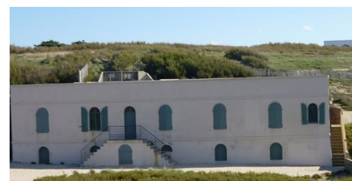
Les 5 parties du monde, la villa pour son fils, sa femme et ses petites filles