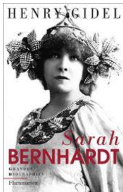
Sarah Bernhardt de Henri Gidel Flammarion, 2006