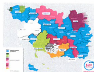
227 communes adhérentes en Production Transport et 116 communes adhérentes en Distribution (en bleu)